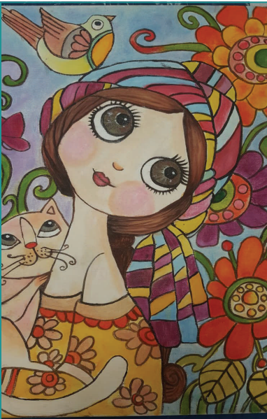
Hümevra BAŞAR, 6D