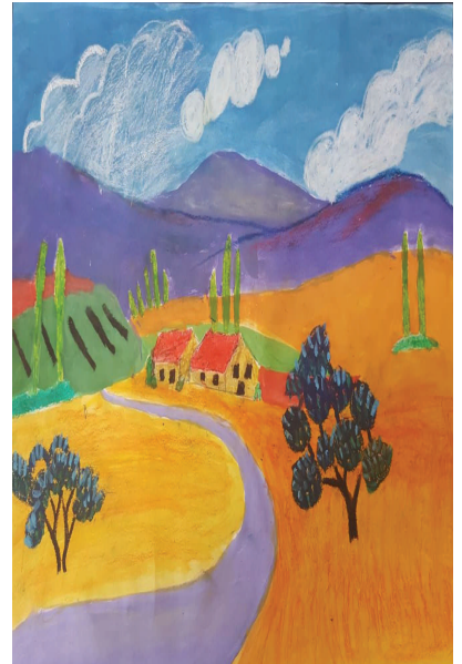
Beyzanur SAYDAM, 6İ